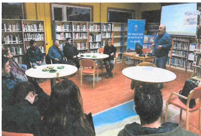
Fotografía 1: presentación INIA Kampenaike, Suplementación estratégica en ganadería extensiva