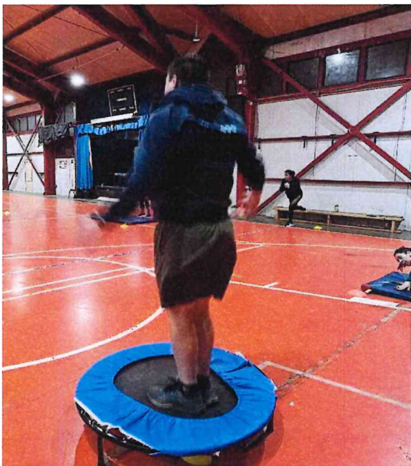
Puerto Williams, 25 septiembre 2024