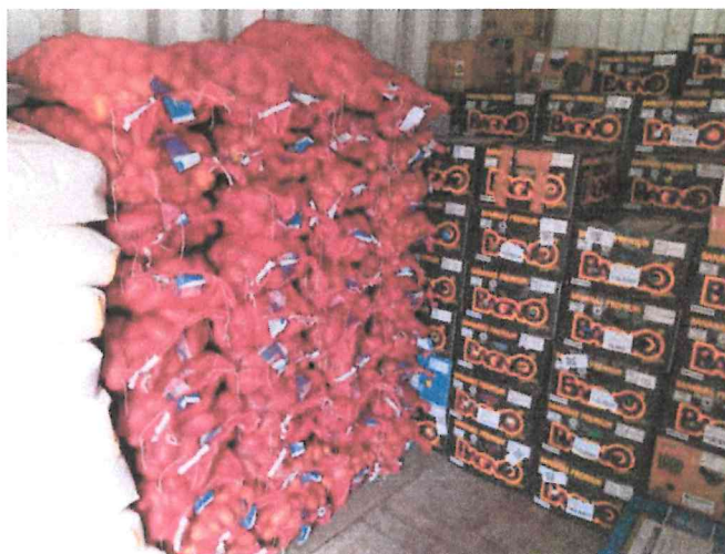
Fotografía 1: semillas de Papa INIA Kampenaike INDAP en beneficio usuarios PRODESAL Cabo de Hornos.