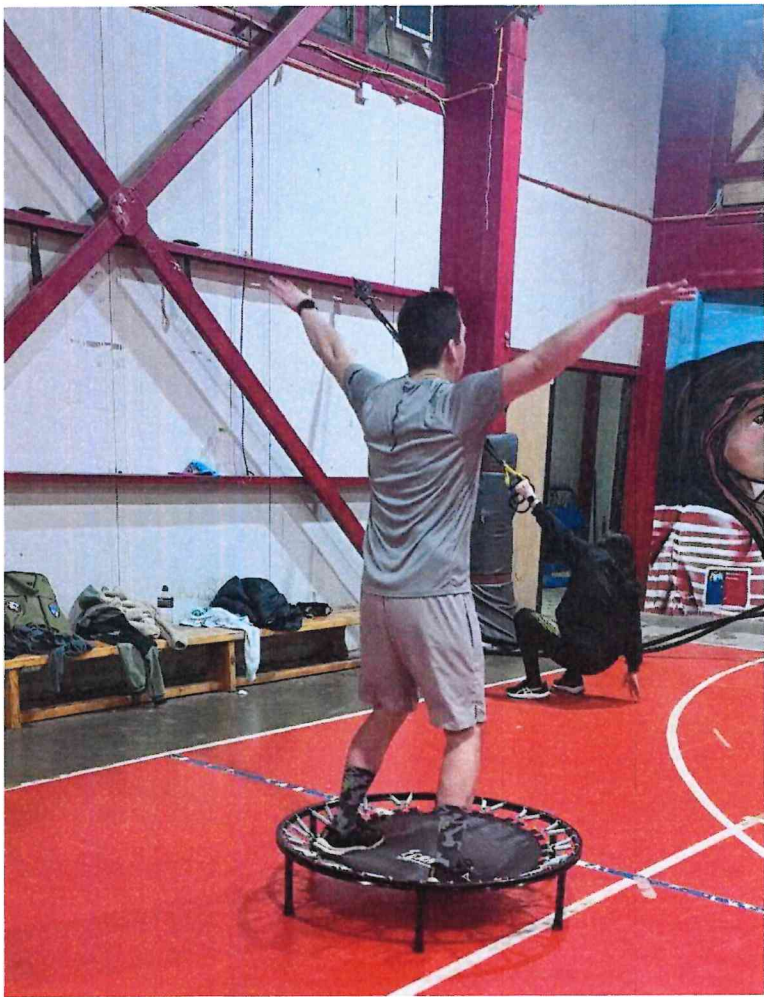
Puerto Williams, 25 de octubre 2024.