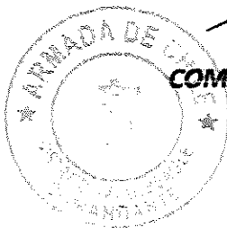
RODRIGO QUEZADA VALENZUELA CAPITÁN DE FRAGATA COMANDANTE DEL DISTRITO NAVAL BEAGLE SUBROGANTE

Sin otro particular, saluda atentamente a Us.,